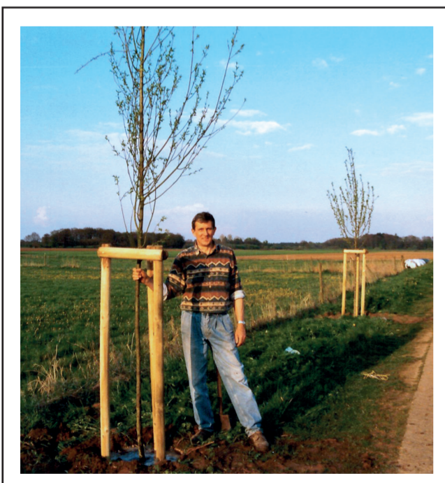
1998: Die Wildbirne