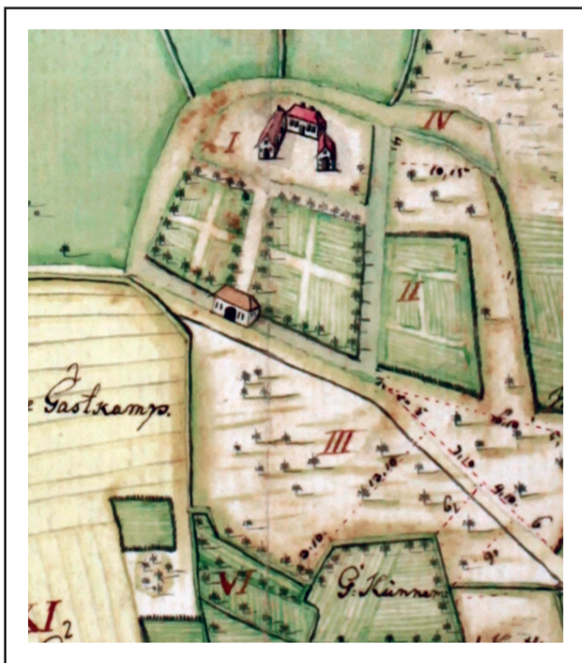
Gut Höven – Karte von 1753