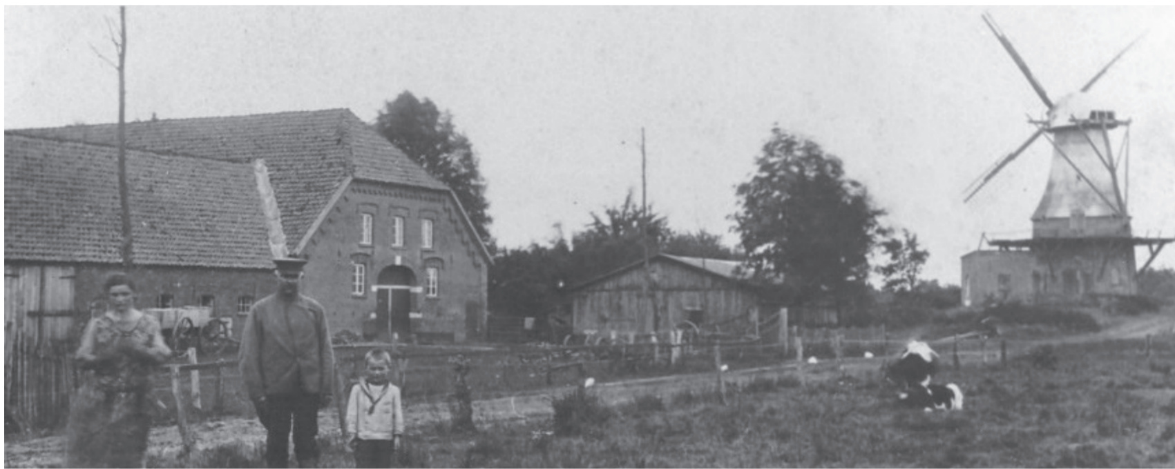
Die Hövenener Windmühle (1904)