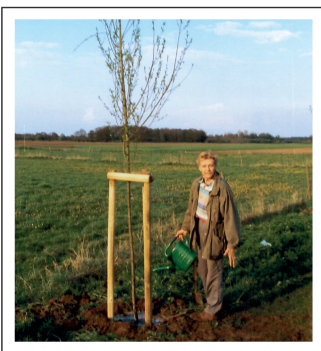
1999: Die Silberweide