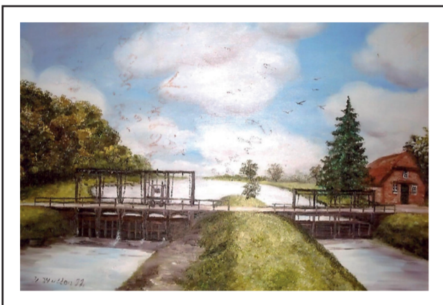
Hauptschleuse in der Hunte mit Nebenschleuse, rechts das Rieselwärterhaus (Gemälde von Ursula Hullen)