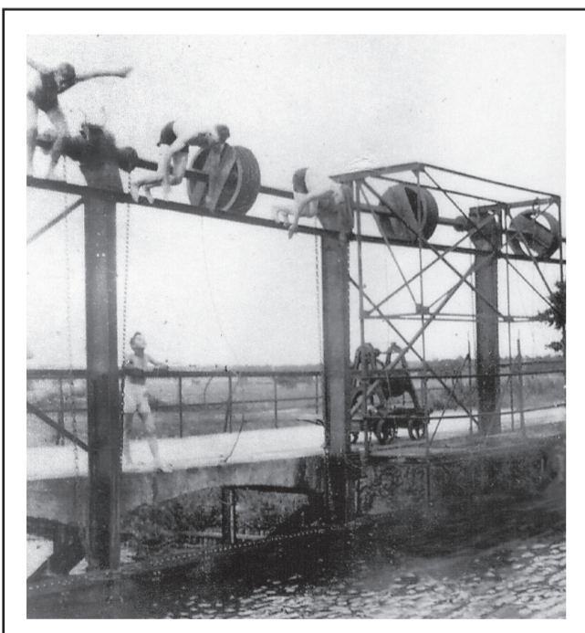
Sprung in die aufgestaute Hunte (1937)

In tausenden von Jahren düngte das über die Ufer tretende Wasser der Hunte die umliegenden Flächen. Mit Beginn des 19. Jahrhunderts begann die Regulierung des Huntelaufes. Zahlreiche Schleifen des Flussbettes wurden durchstoßen. Das Wasser konnte schneller abfließen. Die Überschwemmungen blieben aus und somit auch die Düngung der Wiesen. Eine künstlich gesteuerte Bewässerung sollte die landwirtschaftlichen Erträge wieder steigern. Die großherzogliche Oldenburger Kammer beauftragte im Jahr 1860 den Ökonomierat und Wiesenbauer Louis Vincent ein Bewässerungssystem entlang der Hunte zu bauen. Neben einer großen Hauptschleuse zum Aufstauen der Hunte bis zu einer Höhe von drei Metern, ließ Vincent 50 kleinere Schleusen bauen. Als Standort der Schleusenanlage mit einer tragfähigen Brücke begann man außerhalb des Flussbettes innerhalb einer Fluss Schleife. Nach Fertigstellung führte ein Durchstich das Wasser zur Schleuse. Ein Teil der alten Hunte Schleife ist noch heute vorhanden. Ein kompliziertes